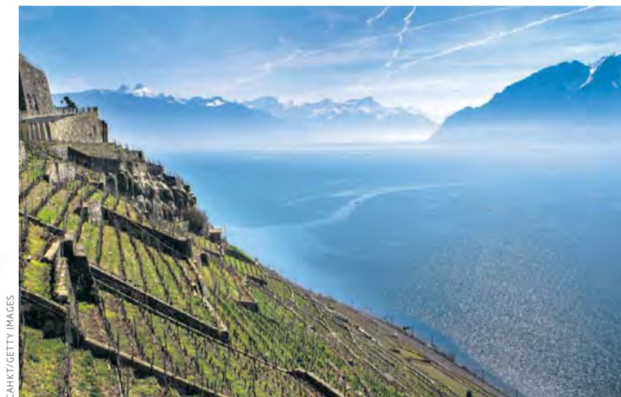
A l'esquerra, regió vitivinícola de Dezaley

No hi ha platges, però no es troben a faltar. Els llacs i els rius tenen aigües prístines; no es pot oblidar que a Suïssa neixen els afluents que ajuden a omplir els grans rius centreeuropeus. La ruta dels Tres Llacs és sens dubte l'excursió de muntanya més espectacular. Situada a la zona del famós resort d'esquí de Zermatt, partint de Blauherd i a 2.500 m d'altitud, comença una caminada de dues hores fins a Riffelalp que passa pels llacs Stelli, Grindje i Grünen. Aquesta ruta, que més enllà de l'altitud no té gran dificultat perquè hi ha pocs desnivells pronunciats, és la que ofereix les millors fotografies del mític Matterhorn o Monte Cervino, la muntanya de la qual pren la forma el Toblerone.