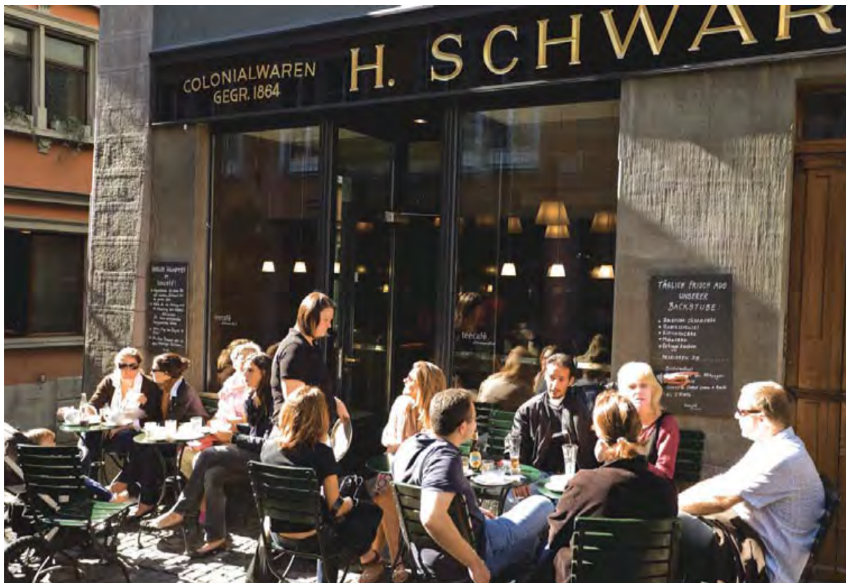
Ubicada a Zuric, H. Schwarzenbach, és una botiga de productes 'delicatessen' on a més torren cafè des de fa 150 anys